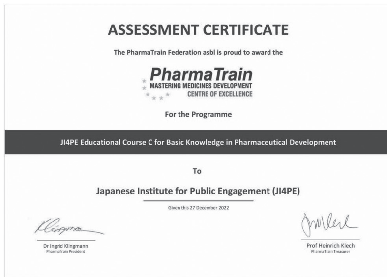
図1. CoEに認定されたJi4peのCコースに対するPharmaTrainからの認定書

先般、No.90・91合併号にも掲載された(一社)医療開発基盤研究所(以下、Ji4pe)の人材育成活動 1) が国際的な医薬品開発教育の認定機関PharmaTrain Federation 2) による審査の結果、社会参画型の多様な教育機会の提供が高く評価され、法人団体としてCentre of Excellence (CoE)として認定されました 3) 。さらに、Ji4peが提供する5つの学習コースのうち、Cコースについても国際教育基準に適合したものとして図1の通り認定されました 4) 。